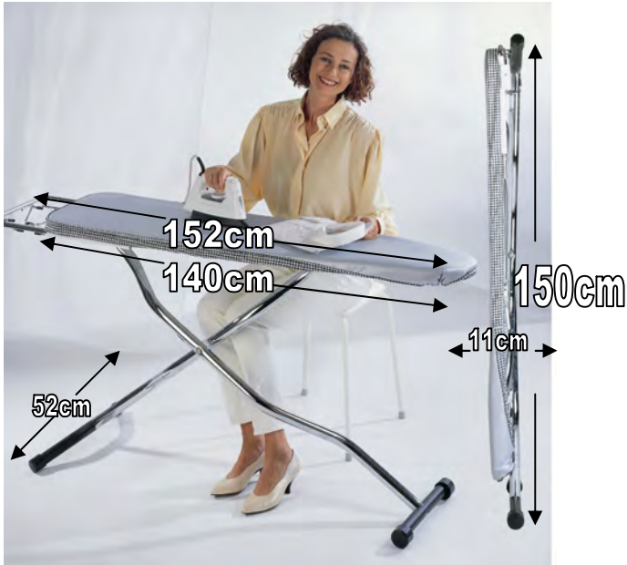
Kettler 2000 & Mabipress