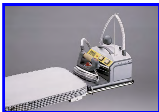
Kettler 2000 & Mabipress

Un repassage parfait, plus facile et plus rapide. La planche à repasser existe aussi dans une version pour gauchers. Elle est facile à installer et à ranger. Gain de place garanti !!!